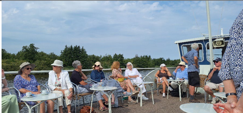
Het vrijwilligersuitje op 14 augustus: vaartocht in Nationaal Park de Alde Feanen in Earnewâld. Prachtig weer met een verfrissende bui tijdens de lunch.

De Tropische Kas bestaat uit een cultuurhistorisch kassencomplex dat behoort bij het erfgoed van de in de 19 e en 20 e eeuw in het Lycklamahûs wonende adellijke familie Lycklama à Nijeholt. De vereniging Vrienden van de Tropische Kas ziet het als haar taak dit complex te behouden, te beheren en te exploiteren op zodanige wijze, dat bezoekers ervan kunnen genieten en de vrijwilligers plezier beleven aan de werkzaamheden die dit met zich meebrengt. De vereniging had dit jaar 285 leden.