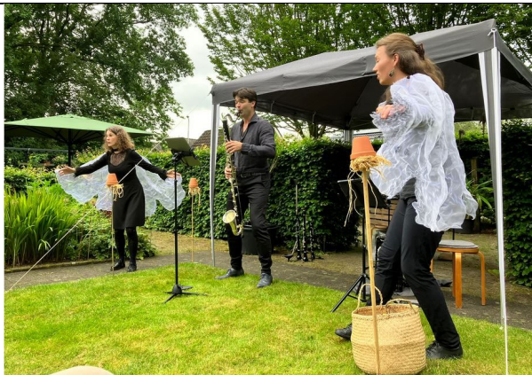
Op de langste dag van het jaar trad het Linnaeus Trio twee keer op: 's middags op het terrein van de kas en 's avonds in het bos naast het kassencomplex. Beide concerten waren goed bezocht.

Op 21 en 23 juni vierden we uitgebreid ons jubileum en de afronding van de renovatie/verduurzaming van de Tropische Kas en de lessenaarskas. Onze historische lessenaarskas dateert uit 1869 en twintig jaar geleden ging de kas open voor publiek. Op vrijdag 21 juni begonnen de festiviteiten met twee unieke optredens van het Linnaeus Trio. 's Middags met Entomophonia! Het Grote verhaal van de Kleine Beestjes en 's avonds het Concert voor de Nacht. De invallende duisternis en het uitzicht van onder de bomen naar de vijver maakte de sfeer uniek. Prachtig!