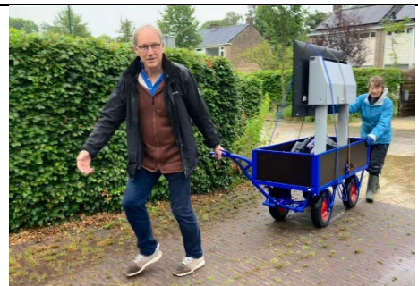
De nieuwe kar is praktischer en lichter dan de oude.