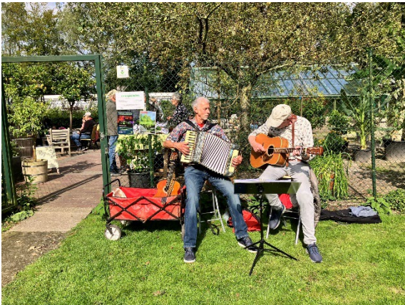
Muziek voor de kas tijdens Open Monumentendag

Aan het eind van het seizoen tenslotte was er op 5 oktober weer de jaarlijkse Appeldag en Streekmarkt, waar onder meer de "Vrienden van het oude fruit" acte de présence geven.