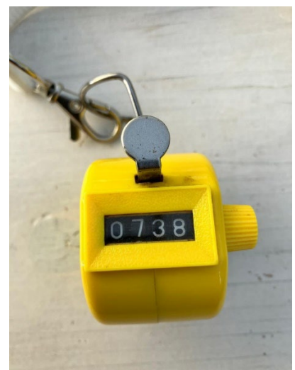
Alle activiteiten werden weer heel goed bezocht!

Door de vele betrokken vrijwilligers is zoals altijd hard gewerkt om onze planten, de gebouwen en het terrein goed te onderhouden. Na de grote projecten rond onze tropische plantenkas en de lessenaarskas hebben we ons dit jaar vooral gericht op het uitvoeren van wat kleinere reparaties en zijn we begonnen met plannen om onze kas verder te verduurzamen. Een deskundige heeft een plan gemaakt voor energiebesparing, waarvan de eerste fase, het vervangen van alle lampen voor led-verlichting is uitgevoerd. In 2025 willen we de volgende stappen nemen. Verder hebben we geïnvesteerd in relatief kleine zaken die het werk weer wat makkelijker en leuker maken. Zo kwamen er een nieuwe parasol, een nieuwe transportkar en een borstel om de ramen zelf schoon mee te kunnen maken. Het dagelijks onderhouden van het terrein en de gebouwen, het water geven van de planten en het ontvangen en rondleiden van de vele bezoekers vraagt een enorme inzet van onze vrijwilligers. Het is mooi dat dat ook dit jaar weer vrijwel probleemloos en in een goede sfeer is gegaan.