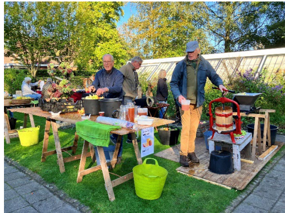
Appels persen op de Appeldag

De kas stelde haar complex in 2024 verder onder andere beschikbaar voor: