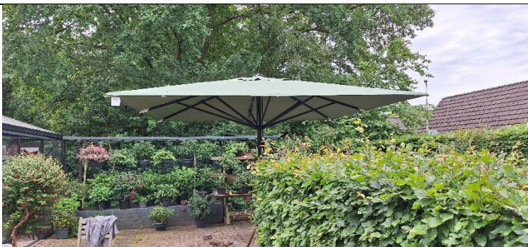
Onze nieuwe parasol: verfrissend tijdens warme dagen!

In 2024 hebben we veel klein onderhoud verricht en is verder gewerkt aan een plan voor het verlagen van de energielasten. De eerste fase daarvan is uitgevoerd. Het is mooi dat we door het in beeld brengen van het energieverbruik en samen met de vrijwilligers nadenken over het beperken van het energieverbruik de energiekosten verder weten te beperken. Trots zijn we ook op de parasol, de geluidsinstallatie en de nieuwe kar.