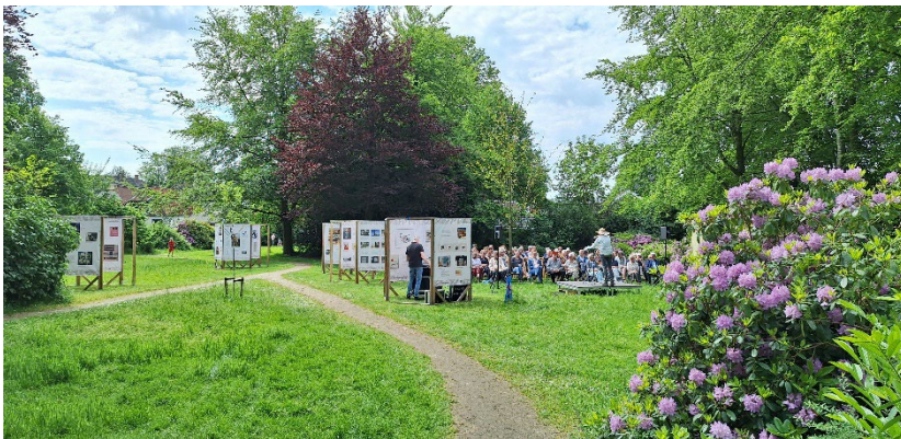
De Loman tentoonstelling leverde ook voor onze kas veel extra bezoek op. Samen maken we Beetsterzwaag nog aantrekkelijker!

We hebben inmiddels een paar tradities, zoals de Groenmarkt in het voorjaar en de Appeldag en Streekmarkt in oktober. Die horen er helemaal bij, maar we blijven op zoek naar nieuwe en behapbare activiteiten. De Loman-tentoonstelling van Stichting Historisch Beetsterzwaag in de overtuin was een groot succes en voor de tweede keer was de kas open tijdens de Museumnacht. Onderdeel hiervan was een prachtige bijeenkomst waarbij de gemeente de naam van de Dichter van Opsterland bekend maakte. En wat was het enorm druk tijdens de Open Monumentendag en het kunstweekend! Juist dan valt op hoe uniek ons kassencomplex is. We prijzen ons gelukkig dat de samenwerking met andere verenigingen en instellingen in Beetsterzwaag goed is. Zo blijven we samenwerken aan een gezellig Beetsterzwaag waar veel te beleven is.